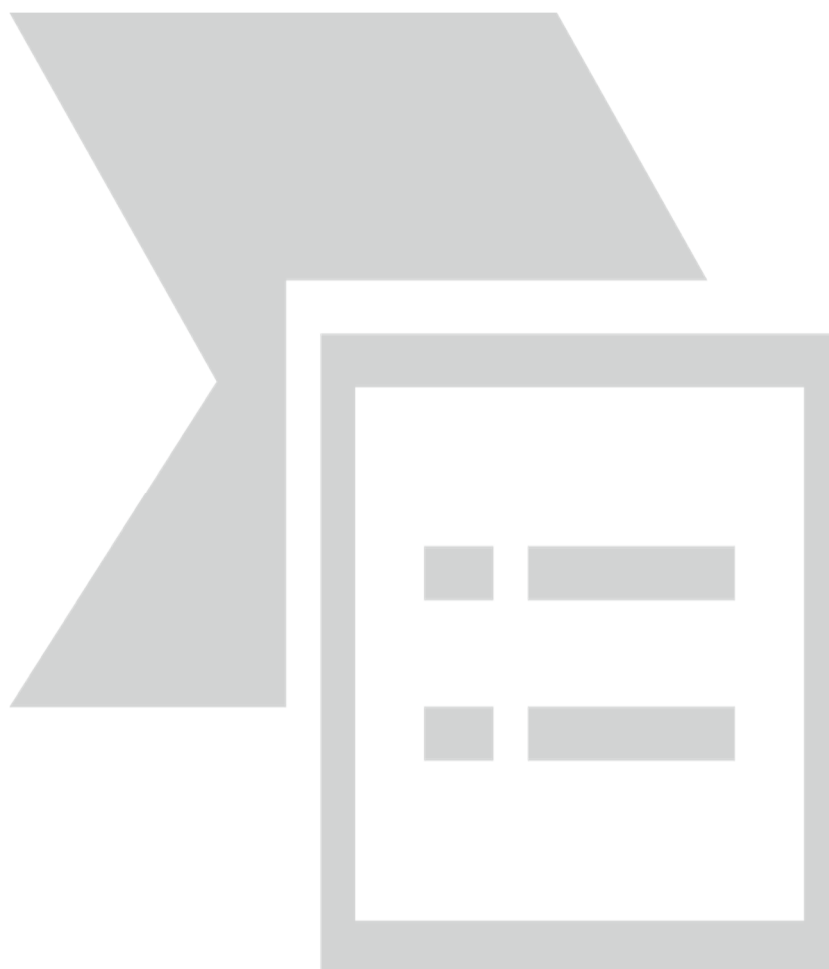
Рабочая стадия работы над кейсом